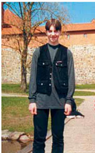
Markas kalba angliškai.