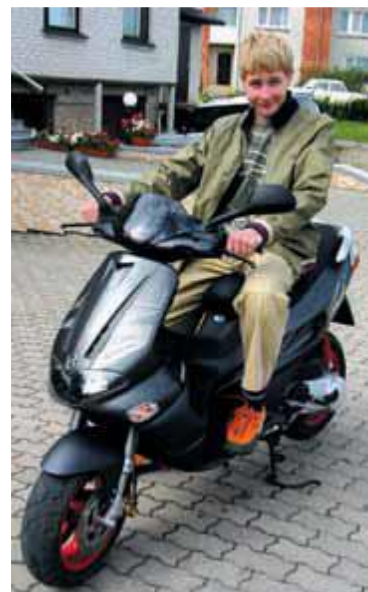
Jonas kalba lietuviškai.